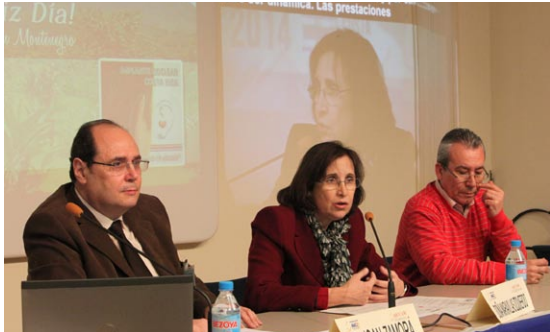
AICE Día IC - Madrid, Maravillas Izquierdo

Barcelona, 25 de febrero de 2014 – Durante la inauguración del acto principal de las celebraciones del Día Internacional del Implante Coclear que tuvo lugar el pasado sábado 22 de febrero en el Museo del Ferrocarril en Madrid Doña Maravillas Izquierdo , Subdirectora General de la Cartera Básica de Servicios del Sistema Nacional de Salud y Fondo de Cohesión, anunció que “en vistas de la mejora de los inicios de la recuperación, tenemos la intención de eximir a los implantados del cargo económico de la prestación ortoprotésica , eliminar el copago de las renovaciones del implante coclear antes de que acabe el año, además de intentar renovar el catálogo de prestaciones de sanidad en el ámbito del implante coclear para finales del segundo semestre.” También manifestó que “no hay suficiente evidencia científica rigurosa del beneficio del segundo implante según las agencias de evaluación de tecnologías sanitarias españolas, por lo que animo a los equipos a publicar resultados que demuestren la conveniencia del implante bilateral”.